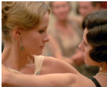
1970 LE CONFORMISTE (Il Conformista) de Bernardo Bertolucci avec Dominique Sanda