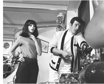
1966 TENDRE VOYOU de Jean Becker avec Jean-Paul Belmondo