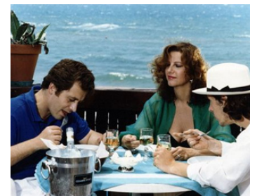
1992 QUELLE NUIT (Nottataccia) de Duccio Cameroni avec Massimo Wertmuller