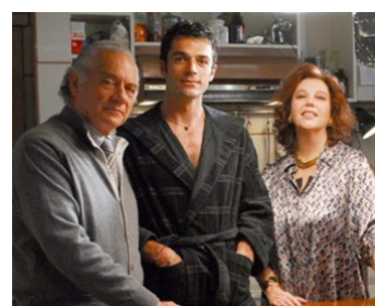
2010 LA FEMME DE MA VIE (La Donna della mia vita) de Luca Lucini avec Luca Argentero, A. Gassman