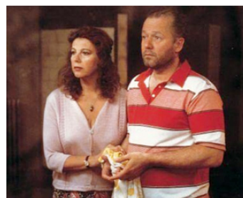
2000 EN ATTENDANT LE MESSIE (Esperando al Messia) de Daniel Burman avec Enrique Piñeyro