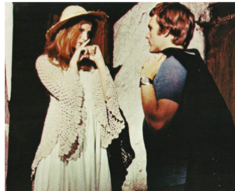
1972 LE DIABLE DANS LA TÊTE (Il Diavolo nel cervello) de Sergio Sollima avec Keir Dullea