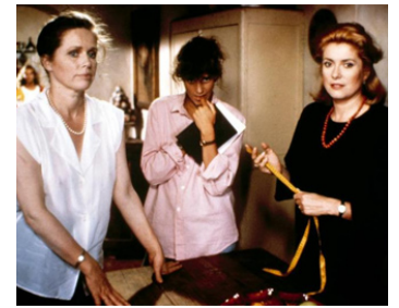
1985 POURVU QUE CE SOIT UNE FILLE de Mario Monicelli avec Liv Ullmann, Catherine Deneuve