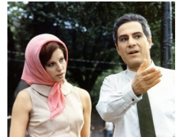
1974 NOUS NOUS SOMMES TANT AIMÉS (C'eravamo tanto amati) d'Ettore Scola avec Nino Manfredi