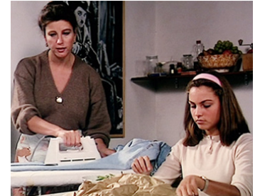
1988 MIGNON EST PARTIE (Mignon è partita) de Francesca Archibugi avec Céline Beauvallet