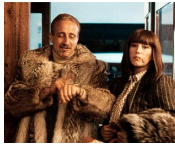
1983 VACANCES DE NOËL (Vacanze de Natale) de Carlo Vanzina avec Guido Nicheli