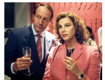
2001 JUSTE UN BAISER (L'ultimo Bacio) de Gabriele Muccino avec Luigi Diberti