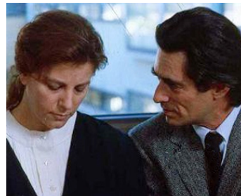
1990 L'AFRICAIN (L'Africana) de Margarethe von Trotta avec Sami Frey