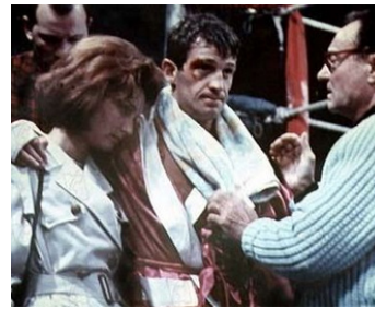
1963 L'AÎNÉ DES FERCHAUX de Jean-Pierre Melville avec Jean-Paul Belmondo