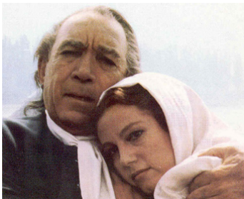
1989 STRADIVARIUS (Stradivari) de Giacomo Battiato avec Anthony Quinn