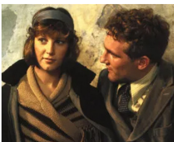
1976 1900 (Novecento) de Bernardo Bertolucci avec Gérard Depardieu