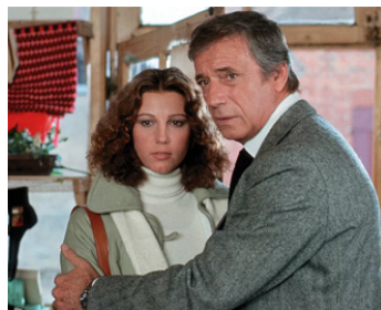
1976 POLICE PYTHON 357 d'Alain Corneau avec Yves Montand