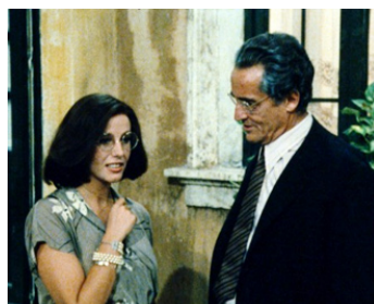
1980 LA TERRASSE (La Terrazza) d'Ettore Scola avec Vittorio Gassman