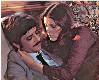
1971 LA TARENTULE AU VENTRE NOIR (La Tarantola dal ventre nero) de Paolo Cavara