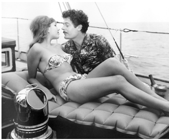
1961 DIVORCE À L'ITALIENNE (Divorzio all'italiana) de Pietro Germi avec M. Mastroianni