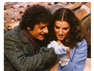
1982 BELLO MIO, BELLEZZA MIA de Sergio Corbucci avec Giancarlo Giannini