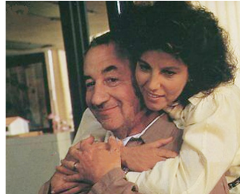
1987 NOYADE INTERDITE de Pierre Granier-Deferre avec Philippe Noiret