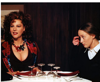
1998 LE DÎNER (La Cena) d'Ettore Scola avec Lea Gramsdorff