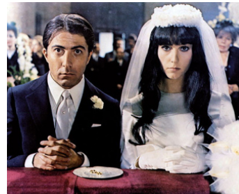
1972 ALFREDO, ALFREDO de Pietro Germi avec Dustin Hoffman