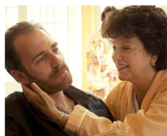
2010 LA PRIMA COSA BELLA de Paolo Virzi avec Valerio Mastandrea