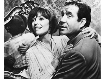
1967 BEAUCOUP TROP POUR UN HOMME SEUL (L'Immorale) de P. Germi avec Ugo Tognazzi