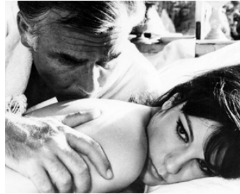
1965 JE LA CONNAISSAIS BIEN (Io la conoscevo bene) d'A. Pietrangeli avec Mario Adorf