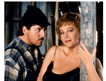
1998 LE FAREMO TANTO MALE de Pino Quartullo avec Ricky Memphis