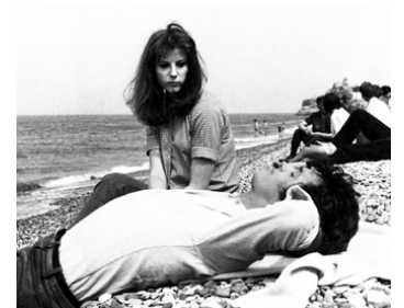
1970 UN ÉTÉ SENTIMENTAL (Un Estate con sentimento) de R. Scarsella avec Robin Phillips