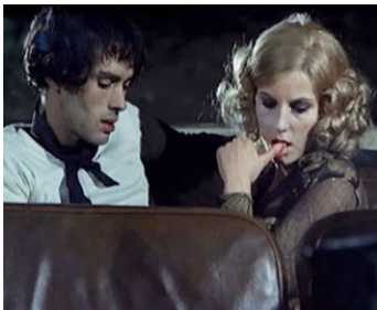
1968 PARTNER (Partner) de Bernardo Bertolucci avec Pierre Clémenti