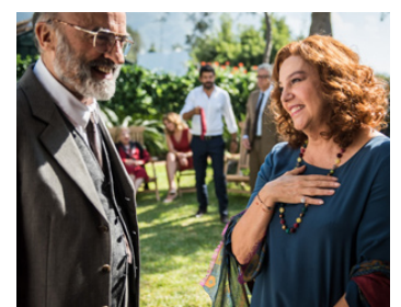
2018 UNE FAMILLE ITALIENNE (A Casa tutti bene) de G. Muccino avec Ivano Marescotti