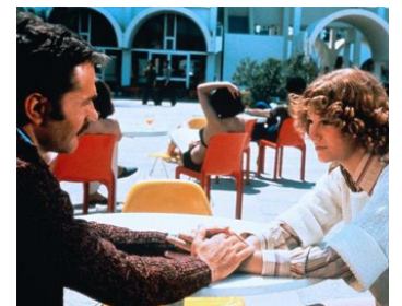
1976 LES MAGICIENS de Claude Chabrol avec Franco Nero