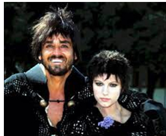
1970 BRANCELEONE S'EN VA-T-AUX CROISADES de Mario Monicelli avec Vittorio Gassman