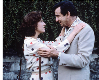
1988 LE PETIT DIABLE (Il piccolo Diavolo) de Roberto Benigni avec Walter Matthau