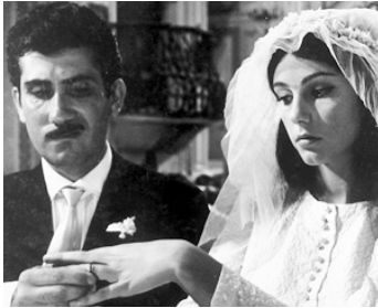
1964 SÉDUITE ET ABANDONNÉE (Sedotta e abbandonata) de P. Germi avec Aldo Puglisi