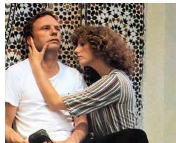
1976 LE VOYAGE DE NOCES de Nadine Trintignant avec Jean-Louis Trintignant