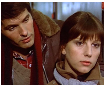
1974 UN VRAI CRIME D'AMOUR (Delitto d'amore) de Luigi Comencini avec Giuliano Gemma