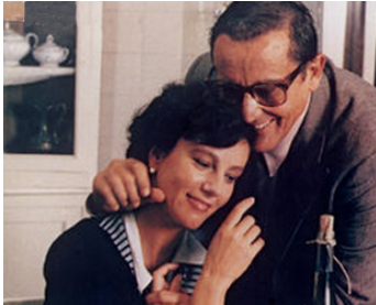
1987 LA FAMILLE (La Famiglia) d'Ettore Scola avec Vittorio Gassman